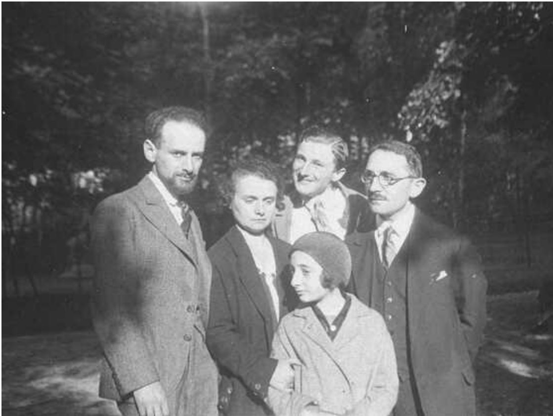
Photographie de la famille Galek

Après les rafles de 1942, la population juive de Loire-Atlantique est décimée. La dernière rafle, le 26 janvier 1944, est aussi meurtrière. À Nantes, 19 personnes sont rafleées, déportées, et assassinées à Auschwitz.