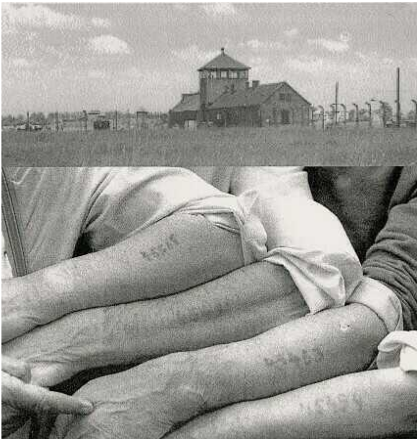
Matricules de déporté.es de la « série des 45 000 »